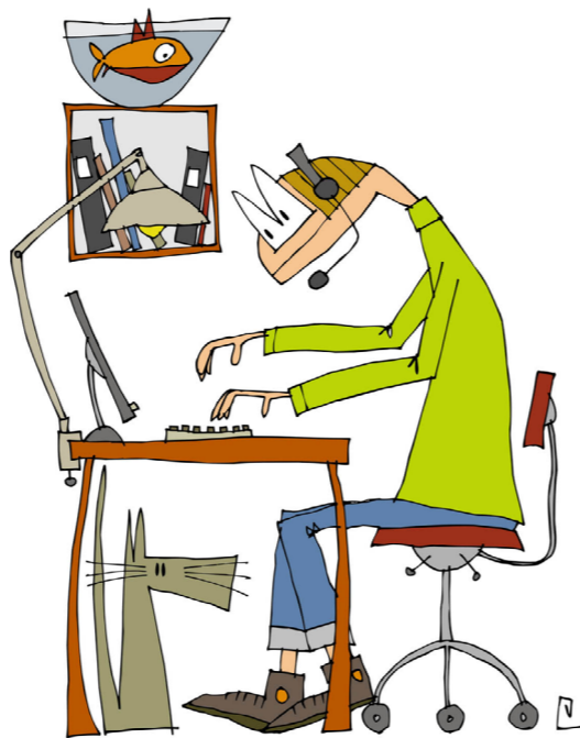
Med portalen ger du dina kunder extra guld-kant på tillvaron.

På detta sätt kommer du som uppdragsförvaltare att spara många samtal och därmed också tid. Portalen är ju dessutom öppen dygnet runt. Enkelt och smart till en låg kostnad.